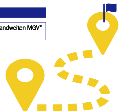
Bild 1: Projektscope